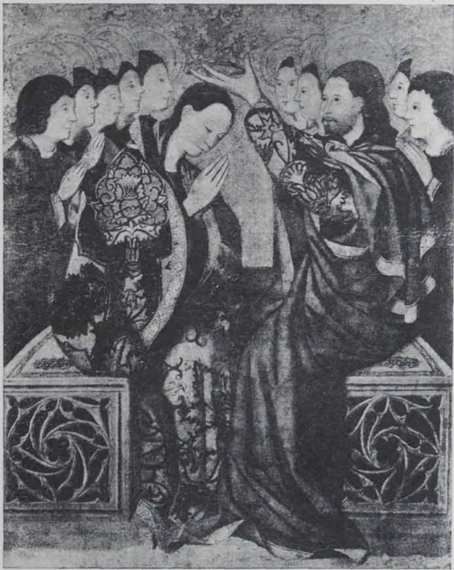
Fig. 353. — La Coronació de la Verge, del Museu de Bóston

Bóston, la gran ciutat de la cultura nordamericana, reuneix entre les seves cases multiformes un immens i colossal museu. No cal aquí descriure el monumental edifici, omplert de joies de tot el món. Els museus americans, a diferència dels d'Europa, donen una importància extraordinària a l'art de la Xina i les obres dels pintors i dels escultors produïdes per aquesta civilització, tan extraordinària com per nosaltres desconeguda. El Museu de Bóston, com en general les institucions culturals nordamericanes, és sostingut completament per donatius particulars.