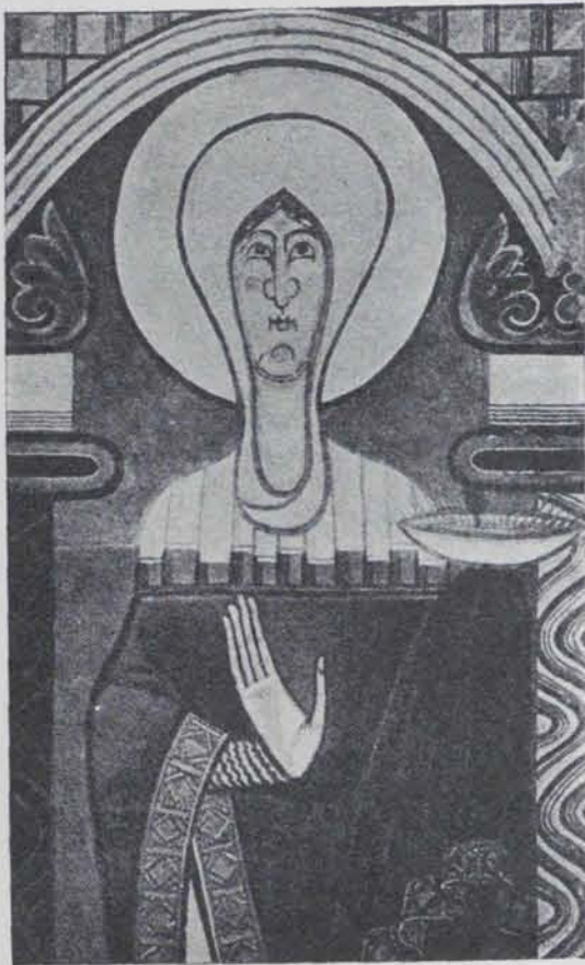
Fig. 356. — Imatge de la Verge. Pintura de l'absis de Sant Climent de Tahull

Trobà l'estàtua la Missió enviada per l'INSTITUT D'ESTUDIS CATALANS a la frontera d'Aragó i Catalunya