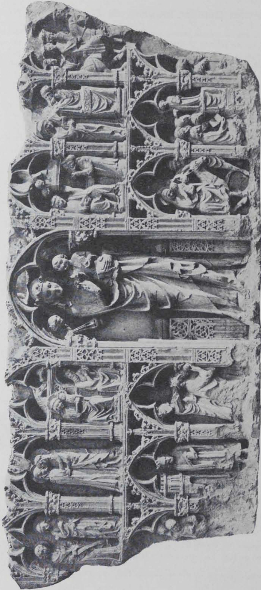
Fig. 354. — Refaule d'Anglesola. Museu de Bóston